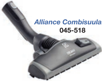
Alliance Combisuulake 045-518