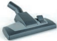
Deluxe Combisuulake 045-189