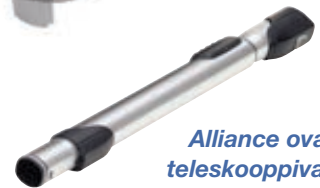
Alliance ovaali teleskooppivarsi 155-277