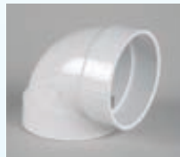
Rasiakulma 90° 030-020