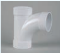
Loiva haara 90° 030-140