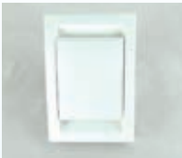
Inno -imurasia 70507

Putkiston ja sen osien asennus soveltuu myös "tee se itse miehelle". Liimattava BEAM -putkisto voidaan asentaa myös lattiavaluun.