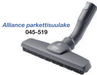
Alliance parkettisuulake 045-519