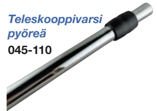
Teleskooppivarsi pyöreä 045-110