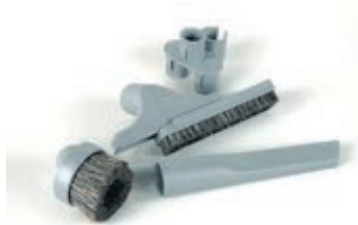
Suulakesarja 3-os. 061-201