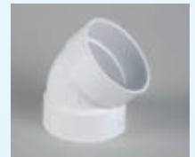
Kulma 45° 030-110

Inno -imurasioita on saatavissa viidellä eri värillä.