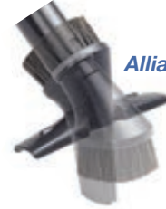
Alliance monitoimisuulake 045-075