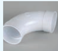
Loiva kulma 90° 030-120